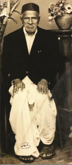
दादा - माझे चुलते

श्रेय दादांनाच. दादांवर पूर्ण कादंबरी होईल इतक्या आठवणी आज दाटून आल्यात.